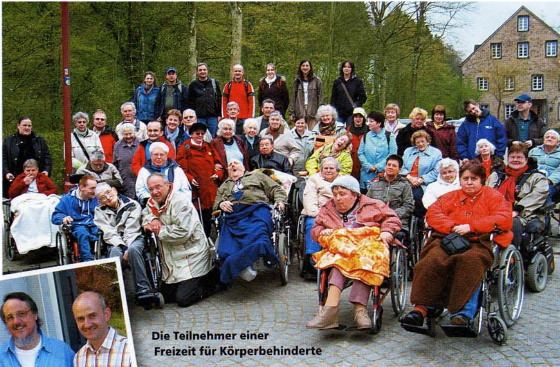
Die Teilnehmer einer Freizeit für Körperbehinderte